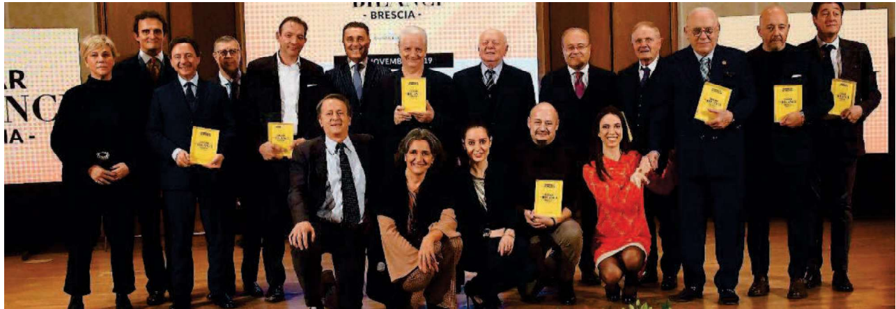
Sul palco di corso Magenta. Tutti i premiati della quinta edizione dell'Oscar dei Bilanci, insieme a rappresentanti di istituzioni e imprese, sono stati i protagonisti della serata

Tutti i numeri di un sistema che scommette sul futuro